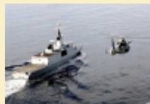
Nouvelle interception de pirates par la frégate La Fayette