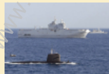
Vol AF447 : Peut-être une chance de retrouver les boîtes noires

En vous inscrivant, vous reconnaissez avoir pris connaissance de la politique de gestion des données personnelles du site