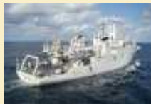
Hydrographie : Arrangement administratif franco-bénois