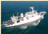
Marine nationale : Le métier d'hydrographe