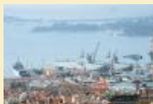
Grand nettoyage pour la rade de Toulon