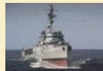
La Jeanne d'Arc va-t-elle tutoyer les 30 noeuds ?