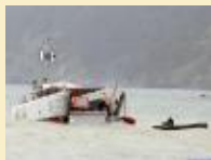
La Seyne-sur-Mer : Campagne de sondage sur une épave