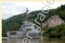
Les adieux de Rouen à la Jeanne d'Arc