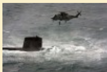
Un sous-marin français déployé avec la flotte anglaise