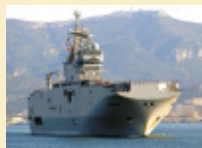
Grosse présence de la Marine nationale en océan indien