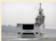
Le BPC Mistral part en Afrique de l'Ouest