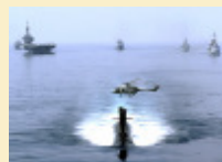
Marine nationale : La réalisation du programme RIFAN 2 notifiée