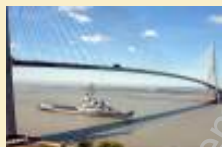
La Normandie fait un triomphe à la Jeanne d'Arc