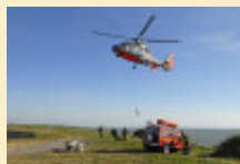
Importante opération de déminage au cap Gris Nez