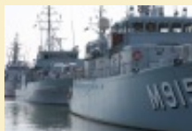
L'OTAN en opération de déminage devant les côtes françaises