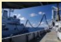
Ultime ravitaillement à la mer pour la Jeanne d'Arc