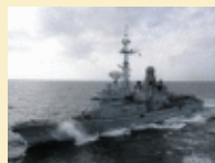
La frégate Jean Bart met le cap sur l'océan Indien