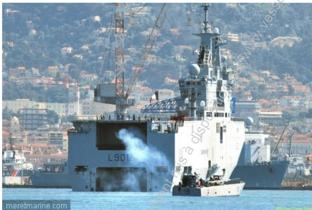
meretmarine.com Enradiage de CTM jeudi(© : JEAN-LOUIS VENNE)

Le bâtiment de projection et de commandement Mistral a appareillé jeudi dernier de Toulon. En petite rade, le BPC a « enradié » deux chalands de transport de matériel (CTM) avant de gagner la mer. Deux hélicoptères de combat Gazelle de l'Aviation Légère de l'Armée de Terre (ALAT) sont également présents à bord. Le Mistral va réaliser un déploiement de plusieurs mois en Afrique de l'ouest dans le cadre de la mission Corymbe (103ème rotation), au sein de laquelle il va remplacer l'avis Lieutenant de Vaisseau Le Hénaff. Depuis 1990, cette mission permanente de la Marine nationale assure une présence navale permanente de la France dans le golfe de Guinée. Elle permet d'assurer le soutien maritime des forces françaises pré-positionnées dans la région, tout en renforçant les liens avec les marines locales et procurer, éventuellement, une aide humanitaire. Ainsi, le BPC transporte 65 tonnes de fret humanitaire à destination de Dakar et Lomé.