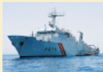
Affaires maritimes et Marine nationale surveillent la pêche au thon rouge