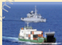
Mogadiscio : La frégate Nivose prise pour cible